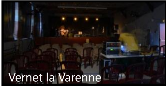
Vernet la Varenne