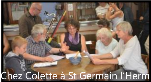
Chez Colette à St Germain l'Herm