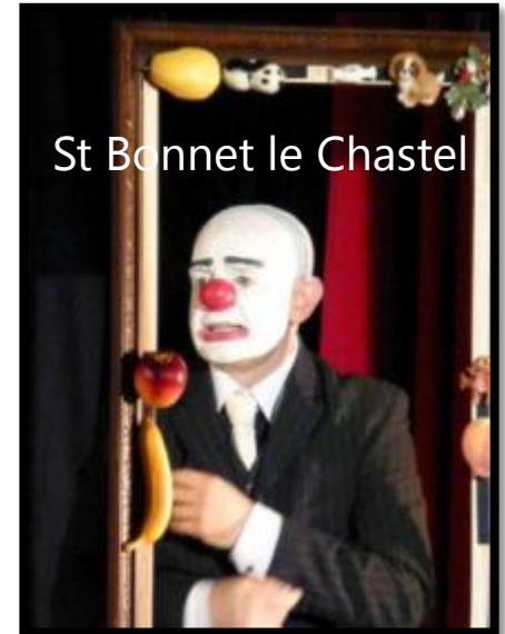
St Bonnet le Chastel