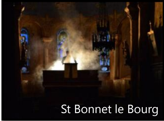
St Bonnet le Bourg