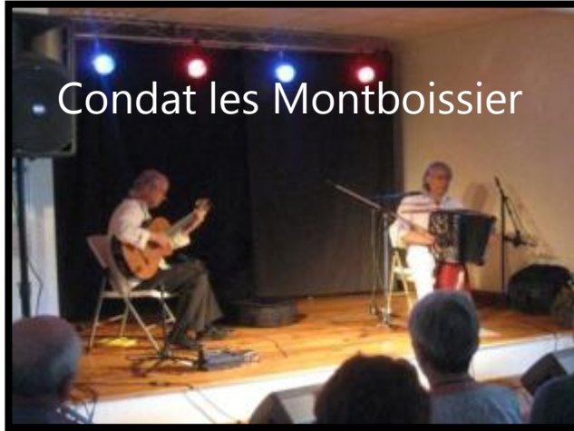
Condat les Montboissier