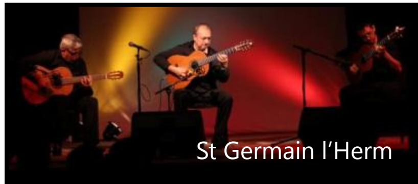
St Germain l'Herm